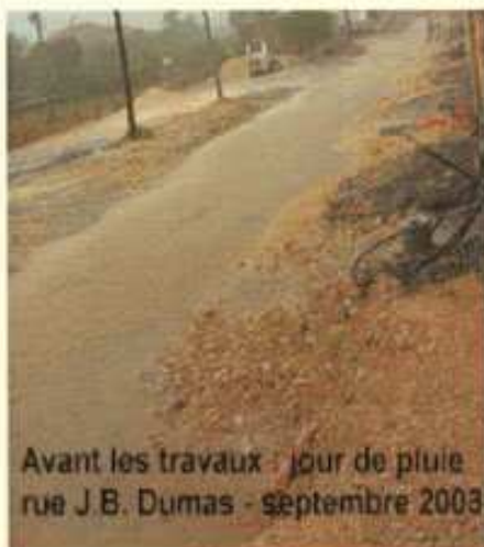
Avant les travaux : jour de pluie rue J.B. Dumas - septembre 2003