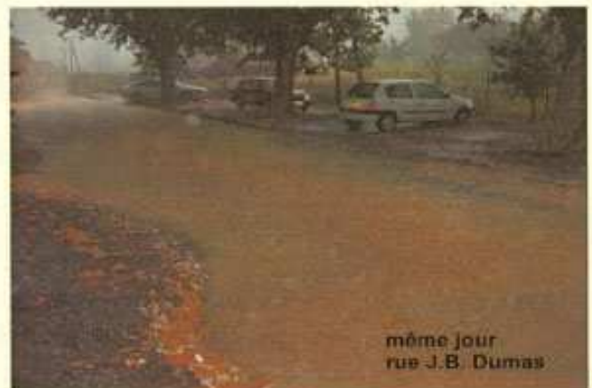
même jour rue J.B. Dumas