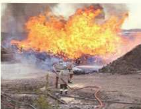
...encore des exercices !

Leur rigueur et leur méthodologie se retrouvent également quand ils utilisent notre "salle à fumée" pour un entraînement sous ARI (Appareil respiratoire Isolant). L'habit ne faisant pas le moine (notre tenue est maintenant identique à celle des "vrais" pompiers)