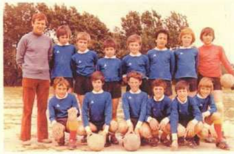
Les reconnaissez-vous ? Vous reconnaissez-vous aux côtés de R. Kuss ?