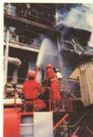
Nous y sommes allés !

Pour revenir à notre équipe des Maisons Moulées , elle comporte : cinq employés en fabrication et deux en maintenance. Ils représentent environ 18% de l'effectif incendie de l'usine . Trois d'entre nous sont chefs d'équipe depuis la fin de l'année 2005. La proximité de notre quartier fait de ces hommes les premiers secours arrivant sur le site (après les quatre ou cinq "postés" présents dans l'usine).