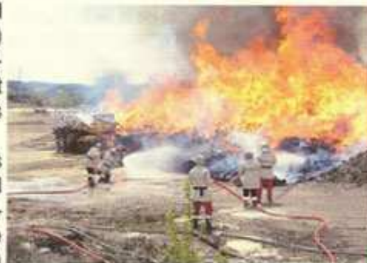
Toujours des exercices....