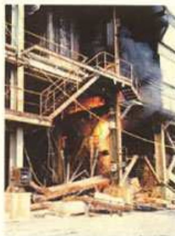
Il faut y aller