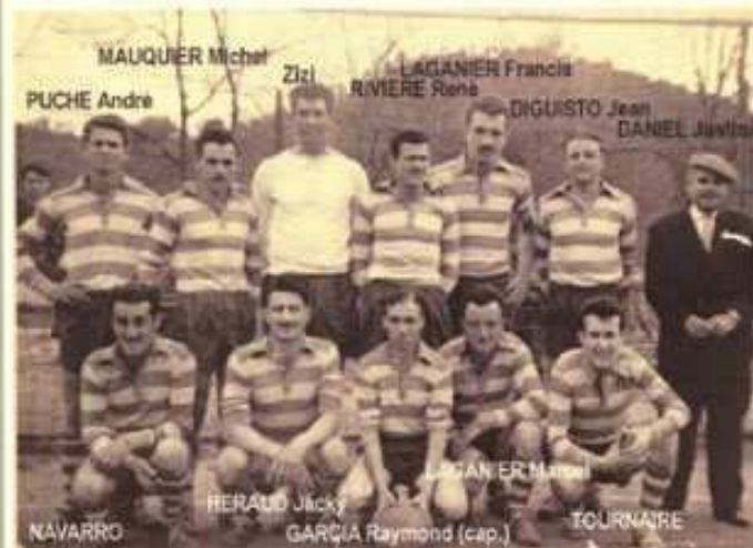
L'équipe des "Maisons Moulées" qui a battu l'équipe du "zinc" 3 à 1