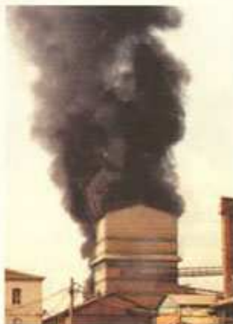
Là ce n'est plus un exercice

L'improvisation, la précipitation, l'inconscience sont autant de dangers potentiels face à un feu ou une fuite de gaz.