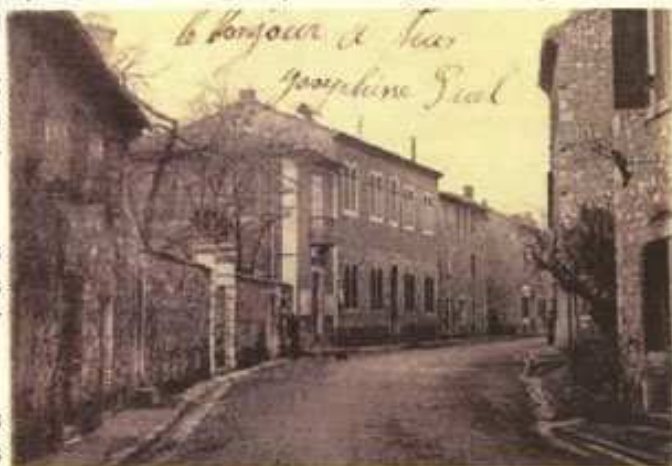
N. 100 - SALINDRES - Rue de la Mairie

Cette salle se trouvant dans les locaux de l'ancienne école de garçons Pechiney (rue Henry Merle), nous demandons à tous ceux qui ont des souvenirs scolaires dans ces locaux de nous contacter... nous aimerions, avec eux, lui redonner son âme.