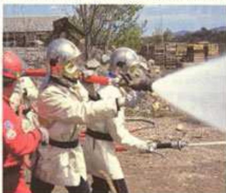
Pompiers d'aujourd'hui à l'entraînement

Avec des "anciennetés" diverses, ils sont tous prêts à partir au moindre coup de sirène vers l'usine quelle que soit l'heure du jour ou de la nuit. Un huitième pompier réside aussi dans notre quartier, lui, il fait partie